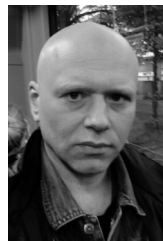
Bilder und Foto: Jens Hunger

Bisher waren die Arbeiten von Jens Hunger an verschiedenen Ausstellungsorten in Berlin, Wien, Köln, München, Hamburg, Düsseldorf, Dresden, Nürnberg, Graz, Würzburg, Bochum, Kassel, Recklinghausen, Regensburg, Osnabrück, Trier, Lüneburg, Schwerin, Weimar und Neuss zu sehen.